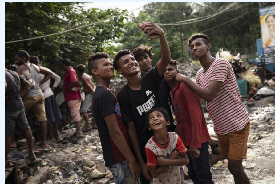
©UNICEF UNI213183 Narain 2019 The boys in the photo are not related to the project

Målet med projektet är att staten i Västbengal vid projektets slut år 2023 har bättre förutsättningar att erbjuda preventiv service för barn som riskerar att bli övergivna eller separerade från sina familjer. Projektet strävar efter bestående effekter genom bland annat färre utförda brott och mindre brottslighet bland barn, ökad barnvänlighet hos myndigheter gällande hantering av brottsfall med barn inblandade, mer resilienta barn och familjer och bättre framtidsutsikter för utsatta barn.